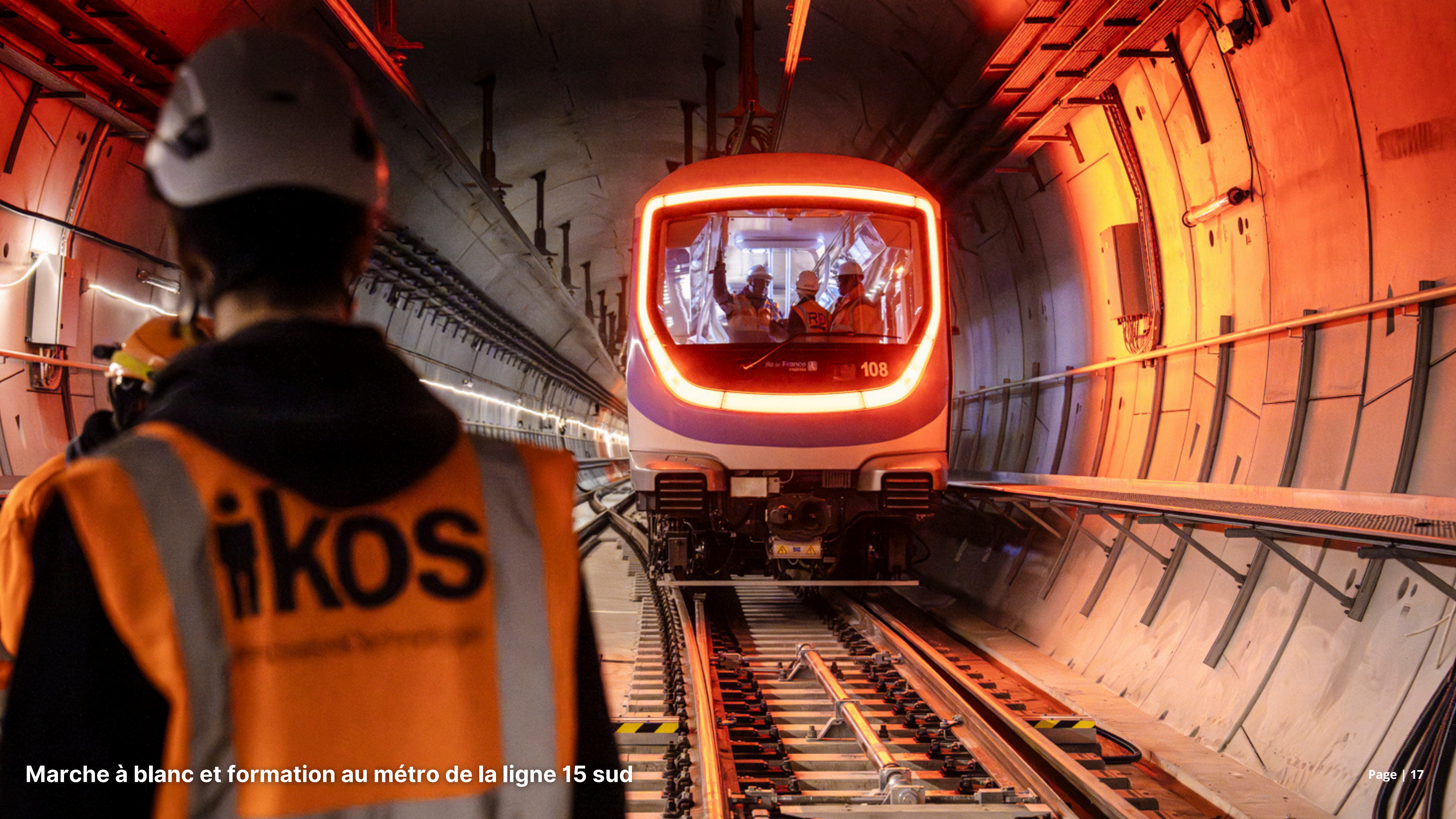
Marche à blanc et formation au métro de la ligne 15 sud